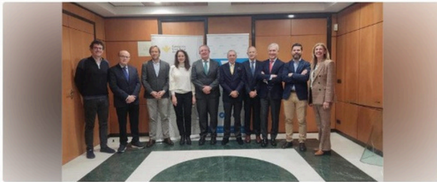
El mentoring de Compromiso Asturias XXI acoge por primera vez un 15% de jóvenes de fuera de la Universidad de Oviedo.

Historia de Europa Press • 2 día(s) • 3 minutos de lectura