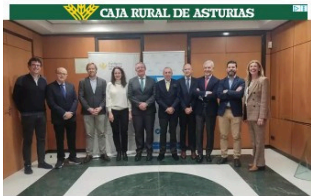
El mentoring de Compromiso Asturias XXI acoge por primera vez un 15% de jóvenes de fuera de la Universidad de Oviedo.