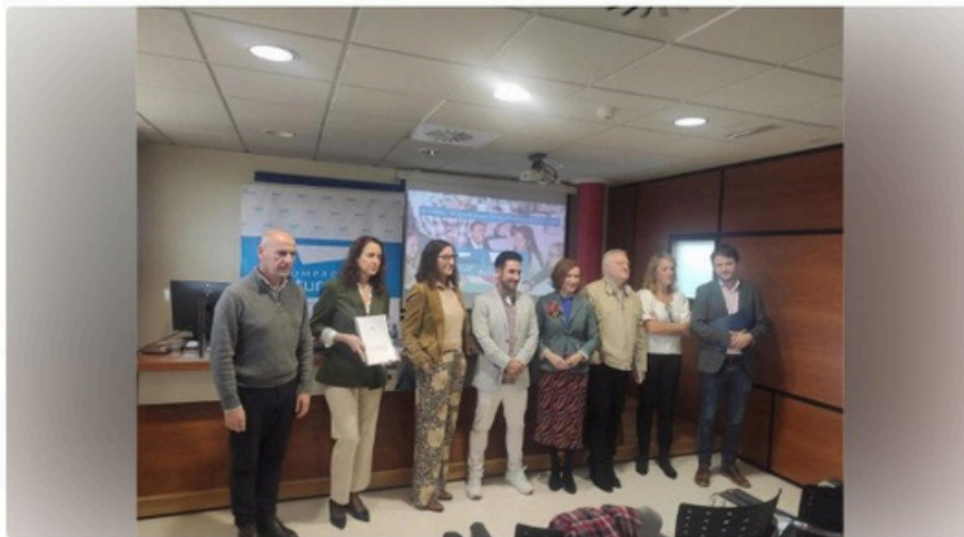
Jornada de Compromiso Asturias XXI sobre educación

Historia de Europa Press • 3 día(s) • 2 minutos de lectura