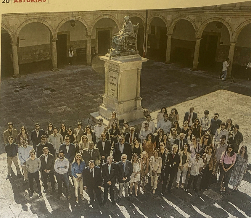
Los mentores y los jóvenes tutorizados, en el patio del Edificio Histórico de la Universidad de Oviedo. PABLO LORENZANA