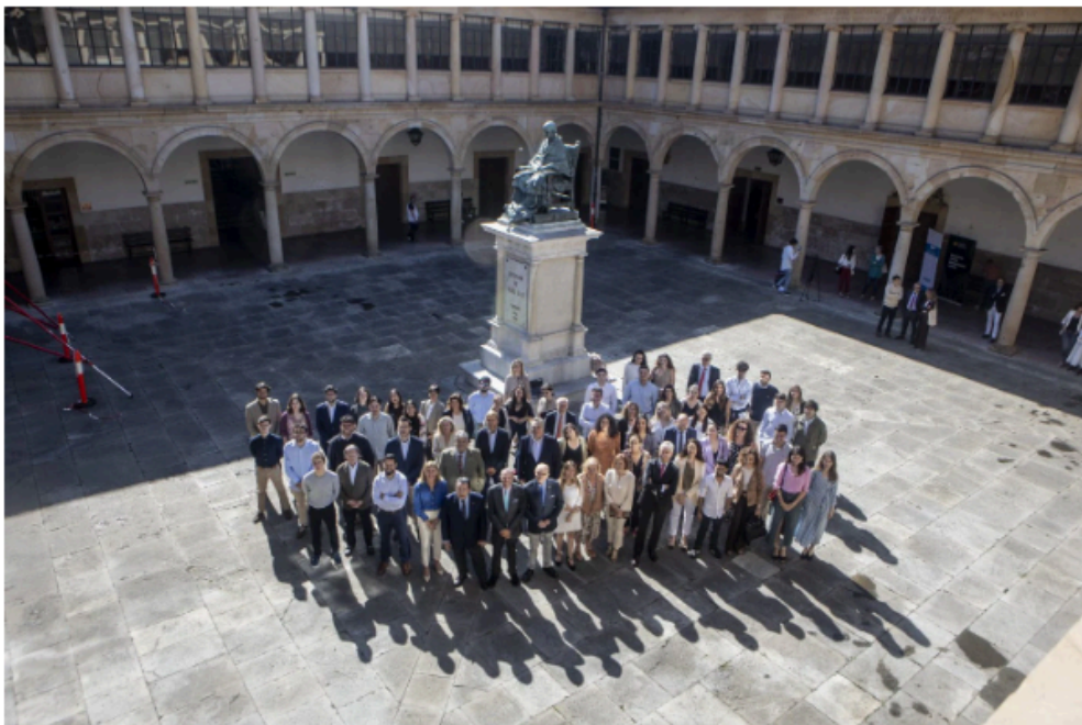
Los mentores y los jóvenes tutorizados, en el patio del Edificio Histórico de la Universidad de Oviedo. PABLO LORENZANA

Compromiso Asturias XXI entregó los diplomas de su programa de mentoring, por el que han pasado ya más de 500 jóvenes