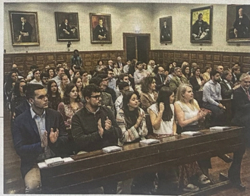
Los jóvenes que terminaron el programa, en el acto de ayer.